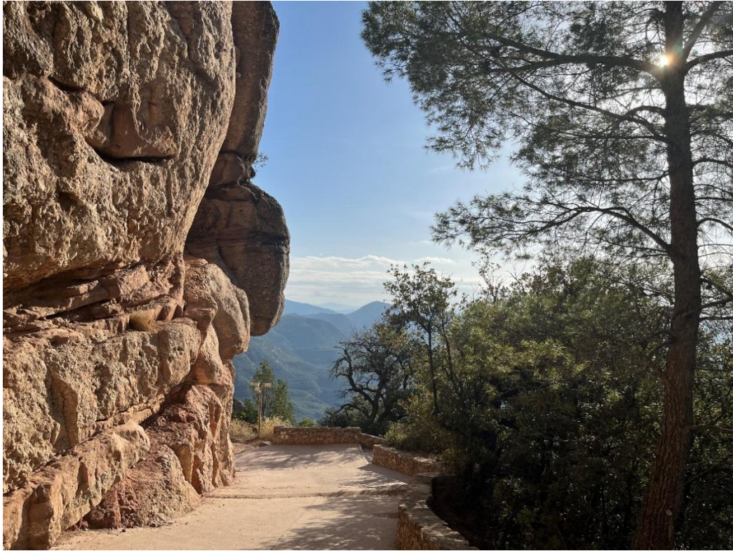
Vejen ved hulen på Montserrat, hvor statuen af den Sorte Madonna blev fundet